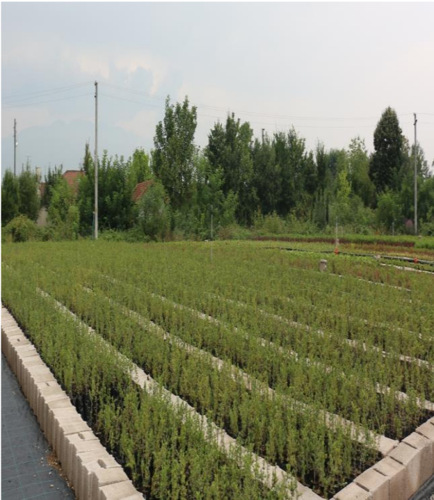
Düzce-Pınar Fidanlığı -2017