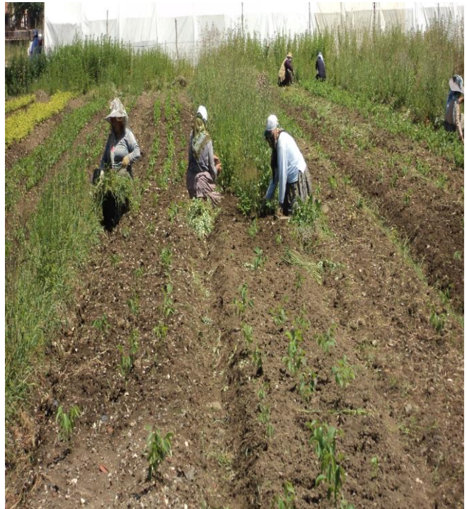
Düzce- Merkez Fidanlığı -2017